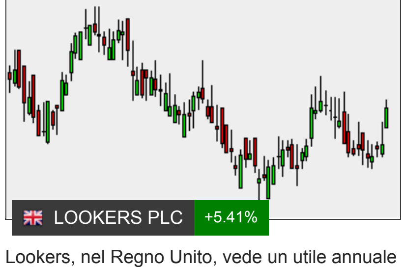
Lookers, nel Regno Unito, vede un utile annuale superiore alle previsioni precedenti