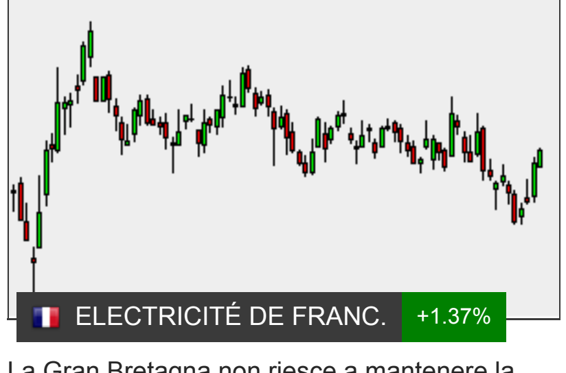
La Gran Bretagna non riesce a mantenere la promessa di emissioni nette zero sul clima - consulenti