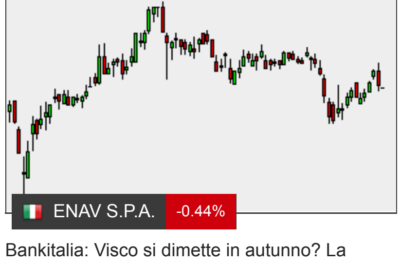
Bankitalia: Visco si dimette in autunno? La strategia di Draghi (MF)