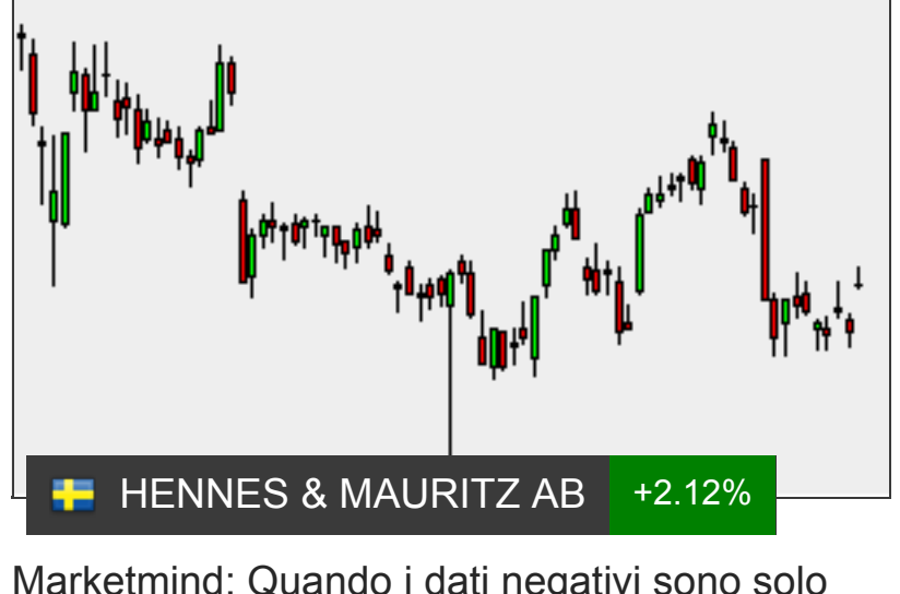
Marketmind: Quando i dati negativi sono solo questo