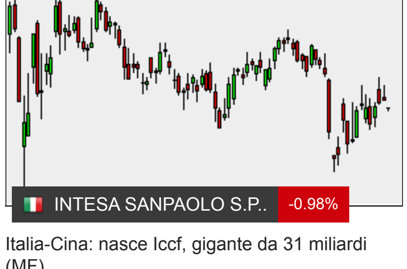
Italia-Cina: nasce Iccf, gigante da 31 miliardi (MF)